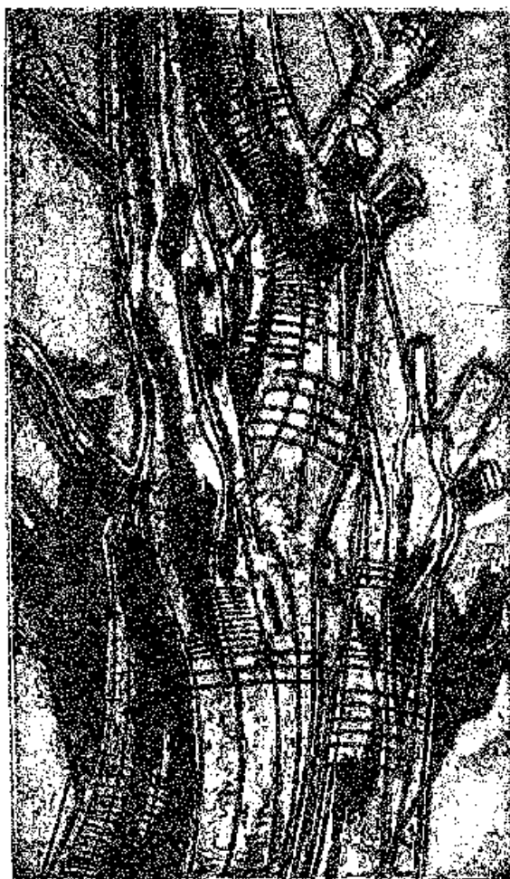
Fák. Raszler Károly rézkarca, C3, C5

Nem a kertjét óvó gazda tiszteletreméltó küzdelmének jó néhány állomását akarom most részletezni, ez