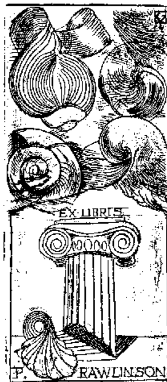
Kőhegyi Gyula rézkarca, C2