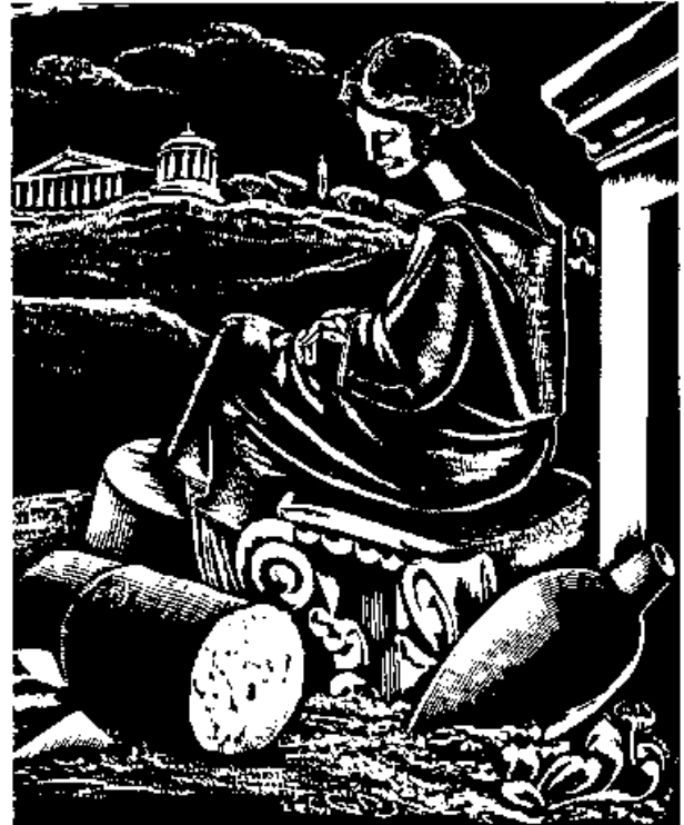
Molnár C. Pál fametszete, X2