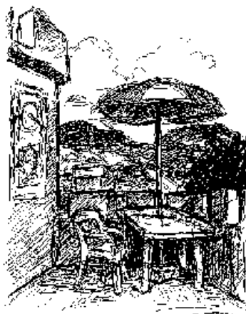
Várkonyi Károly tollrajza

A Debreceni Orvostudományi Egyetem Elméleti Galériájában október 7-ikén, vasárnap délelőtt Kovács Gerzson grafikusművész és Várkonyi Zsolt fotográfus rendezett közös tárlatot Várkonyi Károly grafikusművész emlékére , megidévezve az elmúlt nyáron 91 éves korában elhunyt kiváló mestert. Korábbi művei mellett bemutatták élete utolsó éveiben készült grafikáit, ceruza- és tollrajzait.