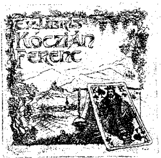
Szilágyi Imre rézkarca, C3