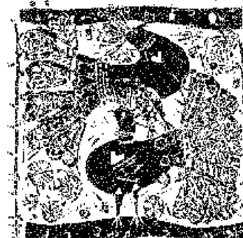
Diskay Lenke fametszetei, X2/2