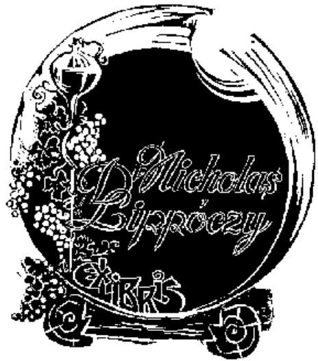
Szilágyi Imre linómetszete, X3